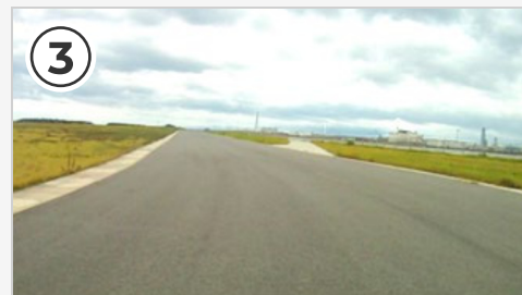
③ 第1コーナーを立ち上がると200mの直線。