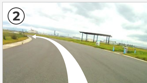
② 第1コーナー。ペースが速い時は自転車が大きく左に倒れ込みます。ペダルが地面と接触しないよう注意！