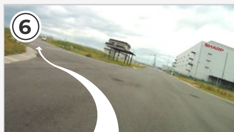
⑥ ゴールまで200m地点。ラスト周回のゴールスプリントはS字コーナーを曲がりながらになります。左右に気を付け、走行ラインを守ってスプリントを行いましょう。