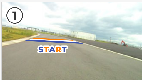
① 道幅十分なスタート地点(左回りで周回)。