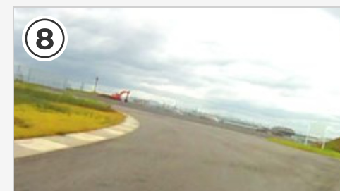
⑧ 左高速コーナー。ペダルと地面の接触到注意。