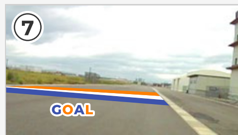
⑦ ゴール地点。 ゴール後コースは緩やかに左へ曲がっています。気を抜かずしっかりと前を見て走りましょう。