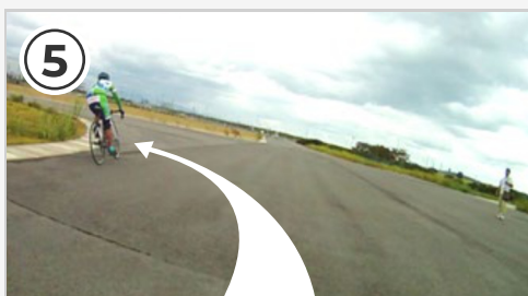
⑤ 左鋭角コーナー。コーナー手前で減速を終えてから自転車を倒し込みましょう。